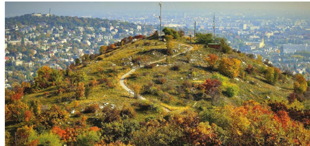
A Sas-hegyi kilátópont a hegy legmagasabb csúcsáról

Gyerekkoromban a Sváb-hegyen laktunk, a hegytetőtől egészen le a Fodor utcáig legelők, erdőfoltok, gazdátlan gyümölcsösök húzódtak. Változatos, kalandos világ volt ez, egyszerre falu és város. A Sas-hegyet messziről láttuk, de a kopár csúcsok nem mozgatták meg a fantáziámat. A Németvölgyi úti iskolából az 50-es években kirándultunk a Sas-hegyre, de sokkal később, felnőttként fedeztem fel magamnak a hegy gazdagságát. Akkor mikor 1973-ban új családdal a természetvédelmi területtől néhány méterre, a Hegyalja útra költöttünk.