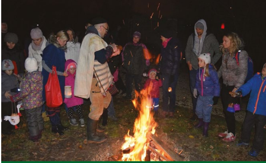
Őszi sötétség. Fotózni nem könnyű, de a gyerekeknek izgalmas.

Te már gyerekkorodban bekapcsolódtál a természetvédelmi munkába.