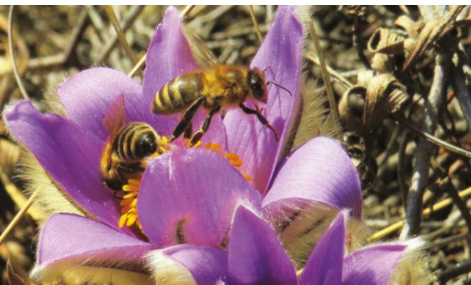
Beporzók szálltak a leánykőöröcsinre