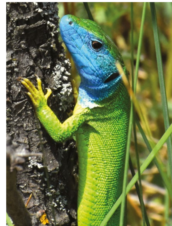
A hímek fejének kék ragyogása nyár közepéig tart

Óriási eredmény, hogy ez a kis sziget megmaradt nekünk. Ugye tudjuk, hogy Pénzes Antal már 1942-ben javasolta, hogy a területet nyilvánítsák védetté, hiszen itt páratlan értékek vannak. Akkor persze a világ nem a természetvédelemmel volt elfoglalva, de 15 évvel később megtörtént a védetté nyilvánítás, és aztán évtizedekkel később a hatékony védelem is megvalósult. Csoda, hogy ebben a pénzéhes világban a Dayka Gábor utca fölött még egy kis pufferzóna is maradt. Itt vagyunk Budapesten, mindig is sok jelentős tudós kutatott a hegyen, így tudjuk, hogy a növényvilágtól a pókfaunáig szinte minden természeti érték megmaradt, ami szerintem csoda! Szerencsére a védelem miatt kicsi a háborgatás, a természet meg tud újulni. Ugyanakkor a nagy folyamatok egyáltalán nem kedvezőek. Az éghajlatváltozás itt is gyorsan halad előre. Én itt a meredek hegyoldal alján tapasztalom a forráságot, a nap pusztító hatását meg azt is, hogy az egyre gyakoribban előforduló villámárvizek mekkora kárt tesznek. Mint nagypapa egyáltalán nem vagyok nyugodt az unokáim jövője miatt. Az emberiségnek gyorsan meg kellene állítani a természet pusztítását. Ami pozitívum, hogy itt a Sas-hegyen legalább késleltetni sikerült ezt a borzasztó folyamatot. Ebben nagy szerepe volt és van a Sas-hegy Védő Egyesületnek.