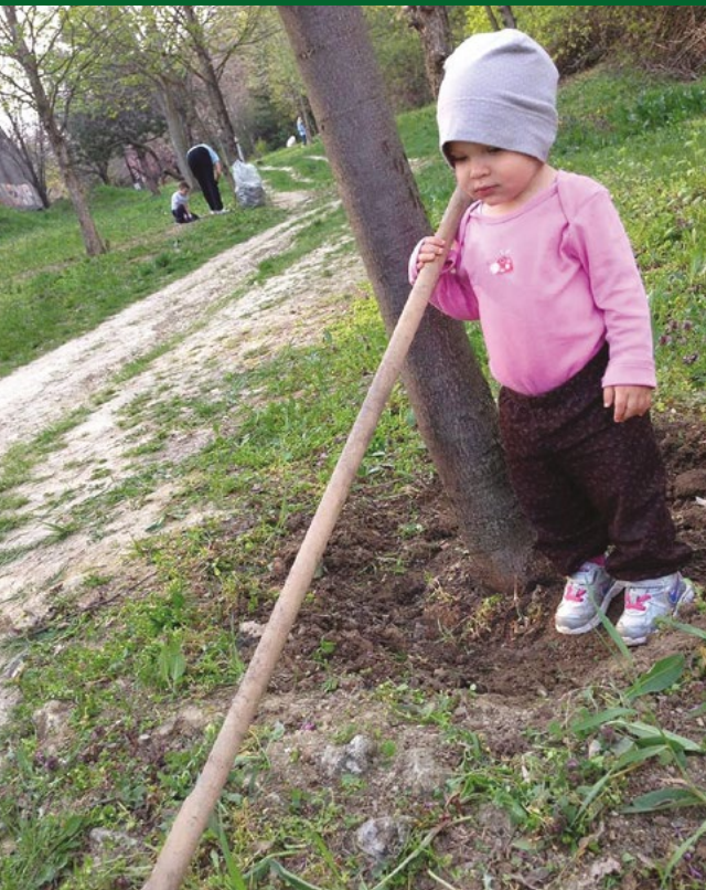
Napi három óra a szabadban – kicsi kortól kezdve!

Ott volt egy barátkozós helyünk a többi kis osztálytárssal meg cserkészekkel, és a déli lejtőn állandóan bandáztunk. A szüleink ennek nem örültek, mert a területen sok volt a hajléktalan, akiknek kutyájuk is volt. Innen a Bodajk utcától fölfelé, a mostani Dayka-Gábor utcai OTP-házak helyén is végig kiskertek voltak egész a Vízművekig. Elvadult cseresznyés, barackos, szilvás. Nekünk ez csodálatos világ volt,