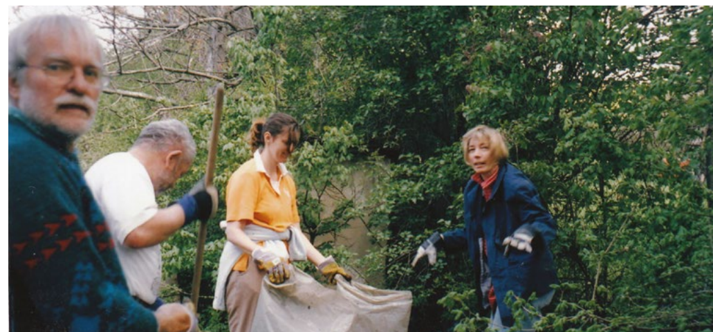
Szenvedélyes szemétszedők. A Sas-hegyen ma már kevesebb dolguk van.

Így van! Nem tudtuk abbahagyni, mert folyamatosan volt feladat. Például 2005-ben egyszer csak azt láttuk, hogy az Olt utca sarkán az építkezéskor kitermelt terméketlen földet egyszerűen áthordták a zöldfelületre, barnává változott minden. Akkor aztán oda is fákat ültettünk, főleg csertölgyeket, hogy mindenki lássa, ez itt nem építési törmeléklerakó.