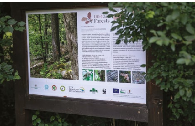
Az átalakítás célja a biológiai sokféleség biztosítása

az Önkormányzat honlapját, és ott látta, hogy útépitést és az ezzel járó átmenőforgalmat rá akarják ereszteni a csendes Dayka Gábor utcára. Sok lakó emlékezett, hogy a 90-es években a Sas-hegy Védő Egyesület azért ültetett fákat a Dayka Gábor utca Vízmu mellett szakaszára, hogy ezzel is lehetetlenné tegye a Dayka Gábor utca két szakaszának egybenyitását, erre most megint felelevenítették ezt az őrült tervet. Több ezren csatlakoztak a petícióhoz, még más városokból is. Hatástanulmányok is születettek, egyértelművé vált, hogy nemcsak az utcák csendjét verné fel az átmenőforgalom, hanem a Sas-hegyi Természetvédelmi Területet is károsítaná, többek között a haragos siklót és a pannonyikot is veszélyeztetné. Na, ez a pannonyik volt, amit a sajtó is felkapott, ez a kis gyík védte meg a területet.