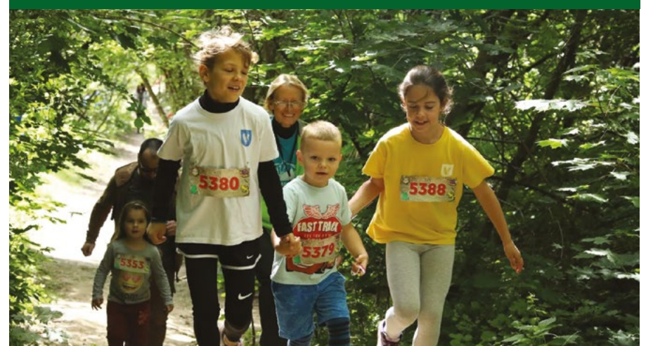
Az első sas-hegyi futás nagy siker volt

Azért ez az „öregedő egyesület” túlzás. Egyrészt most már az elnökségben is vannak 30-asok, másrészt szükség van az idősebbek bölcsességére. Persze tényleg van igény arra, hogy az Egyesületben legyenek fiatalok. A lényeg az aktivitás, a tenni akarás, és hogy vonzóvá váljunk kifelé.