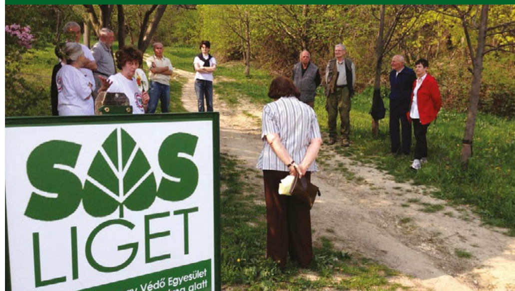
Az ültetés után 30 évvel is van mit tenni kedves ligetünkben

Mi az hogy! A déli lejtőről egy évtizeden át óriási mennyiségű szemetet pakoltunk a konténerekbe, amelyeket az Önkormányzat hozatott. Általában tavasszal volt szemétszedő akciónk, faültetés meg ősszel, hiszen az ősszel ültetett fák jobban megerednek. Aki részt vett az akciókban, az érezte, hogy fontos dolgot tesz a lakóhelye érdekében. A faültetést régen kezdtük, folyamatosan dolgozunk, és persze minden rokon kezdeményezést örömmel fogadunk. Legújabbban a „10 millió fa” mozgalommal is együttműködünk.