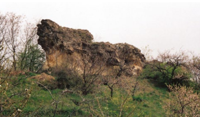
Az Ugató-szikla tavasszal, tényleg kutya formája van

ahol dzsungelharcost játszottunk. A völgy alján egy árok ment végig, és egyetlen ösvény volt a mostani Sas-ligetig. Egész le a lakótelepig murvás út volt. A fenntartása úgy történt, hogy jött egy furcsa autó, és olajréteget húzott a murvára. Utána meg hetekig iszonyatos olajszagban úszott az egész hegyoldal.