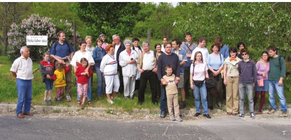
2005. május. A Sas-hegyi séta résztvevői a tölgyfánál gyülekeznek

fontos volt, hogy az Egyesület megalakulását egy tölgyfa ültetésével is ünnepeltük, ez a fa mára már nagyra nőtt, ott van a Dayka Gábor utca és Brassó út sarkán.