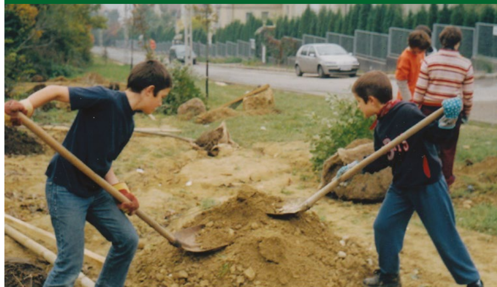
Lelkes faültetők valamikor a kétezres évek elején

Hát ezek a hajléktalanok egymással is küzdöttek a jobb házak birtoklásáért, aminek az lett a vége, hogy időről időre felgyújtották a konkurens házaikat. És ilyenkor volt szükség Fekete Gyurira meg a tűzoltókra.