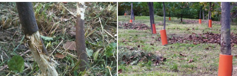
Kis fák barbár damilos fűnyírás után