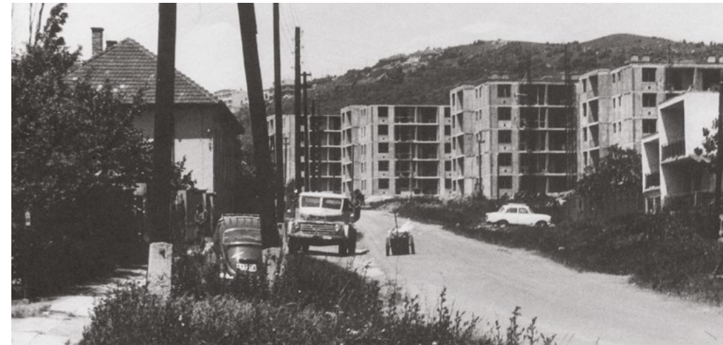
1972: épülnek Margiték mini lakótelepének házai

1972 karácsonyán költöztünk, és a környékbeli őslakók joggal haragudtak azokra a középblokkos házakra, amiket nekünk ide építettek, mert ez korábban egy családi házas övezetben lévő barackos volt. Ezek a blokkok tényleg kilógnak a környező családi házas övezetből.