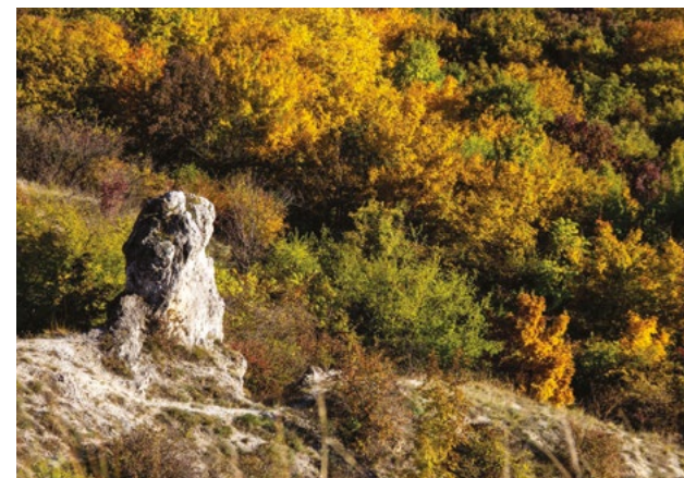
Kell egy kis fantázia, hogy belelássuk Beethovent

Szinte mindig. Még verset is írtam róla. Ha egy pillanatra elfelejténém, ott vannak a látványos kőszálak, a déli oldalon a Beethoven-szikla, a keleti meredélyen pedig a Medve-szikla. Meg persze sok név nélküli sziklatömb. Közöttük kapaszkodva arra gondolok, hogy akár az olasz Dolomitokban is járhatnék, mert a kőzet ugyanaz.