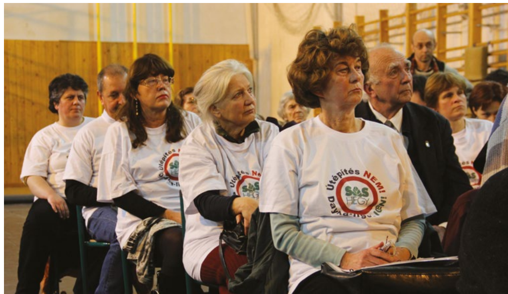
Tornasorban ülő fegyelmezett tiltakozók 2013 januárjában

Persze, kicsiben mi is próbálkoztunk, de azért igazán a Duna-Ipoly Nemzeti Park Igazgatóság indította be a látható változást. Mindjárt erről is kérdezlek, de még előtte a Dayka Gábor utca megnyitása elleni tiltakozásról. Ebben te már nagyon aktív szerepet játszottál.