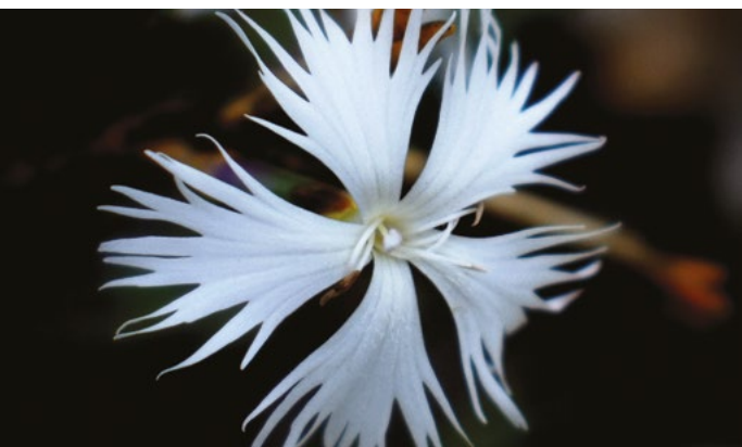
Az István király-szegfű cifra virágai